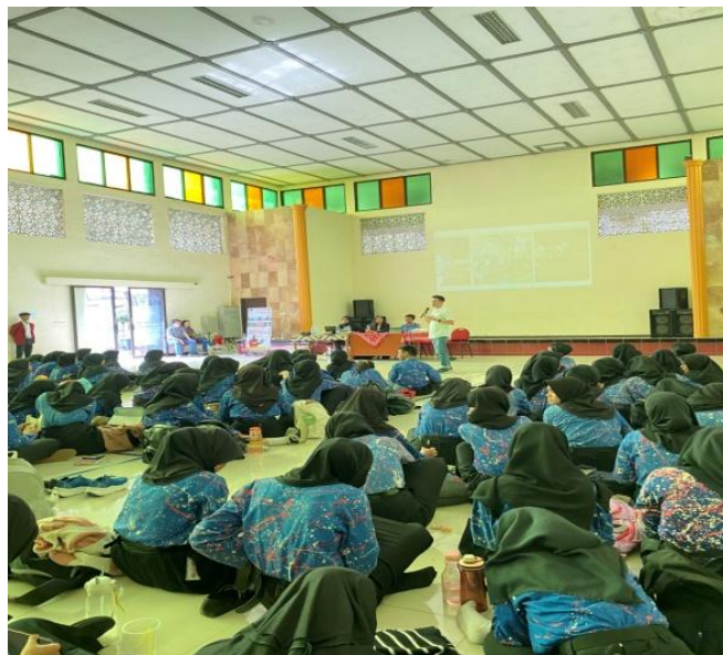
Gambar 2. Pengisian Peta Minat Pribadi oleh siswa

Pada tahap pemetaan minat pribadi, siswa diminta mengisi lembar kerja yang berisi aktivitas yang disukai, keterampilan yang dimiliki, serta nilai yang dianggap penting. Siswa tampak antusias mengikuti kegiatan ini (Gambar 2).