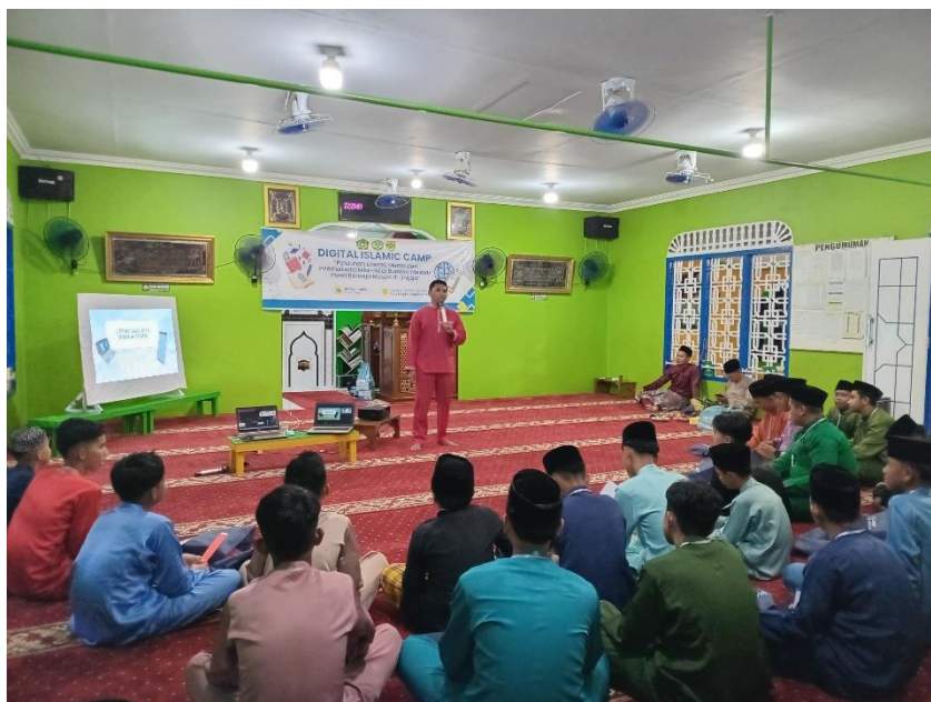
Gambar: 1.2 Sosialisasi Literasi Digital dan Berita Hoax

Lebih lanjut, analisis ini menyoroti adanya transformasi peran subjek dari seorang konsumen pasif menjadi individu yang memiliki agensi melalui tindakan resistance (perlawanan). Penggunaan istilah perlawanan di sini sangat menarik karena tidak bersifat destruktif, melainkan konstruktif dalam bentuk tanggung jawab digital. Hasil akhir yang diharapkan sangat konkret, yakni kemampuan remaja untuk memutus rantai disinformasi dengan tidak menyebarkan hoaks serta keberanian untuk melakukan kurasi aktif melalui pelaporan konten berbahaya. Secara keseluruhan, kalimat-kalimat tersebut menawarkan solusi preventif berupa "imunisasi intelektual" bagi remaja agar mereka mampu menavigasi ekosistem digital secara kritis dan berdaya.