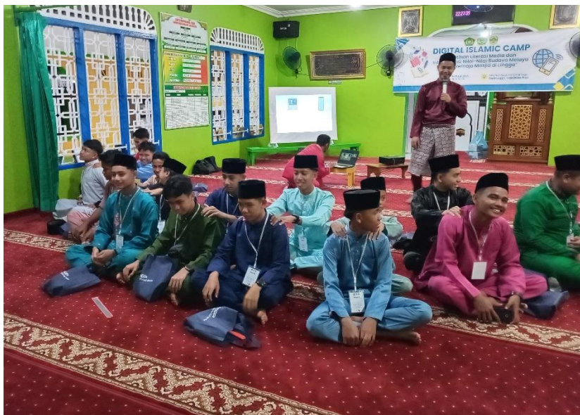
Gambar: 1.1 Sosialisasi Etika Komunikasi Digital dan Budaya Melayu

Lebih lanjut, analisis ini menyoroti adanya transformasi peran subjek dari seorang konsumen pasif menjadi individu yang memiliki agensi melalui tindakan resistance (perlawanan). Penggunaan istilah perlawanan di sini sangat menarik karena tidak bersifat destruktif, melainkan konstruktif dalam bentuk tanggung jawab digital. Hasil akhir yang diharapkan sangat konkret, yakni kemampuan remaja untuk memutus rantai disinformasi dengan tidak menyebarkan hoaks serta keberanian untuk melakukan kurasi aktif melalui pelaporan konten berbahaya. Secara keseluruhan, kalimat-kalimat tersebut menawarkan solusi preventif berupa "imunisasi intelektual" bagi remaja agar mereka mampu menavigasi ekosistem digital secara kritis dan berdaya.