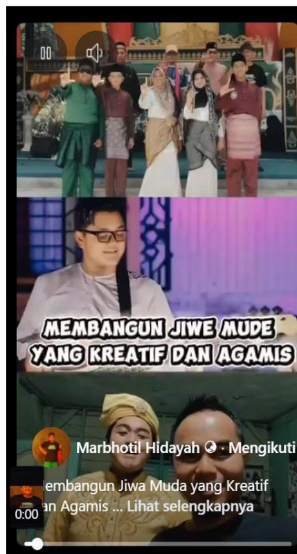
Gambar 1.4 Salah satu capaian hasil pelatihan