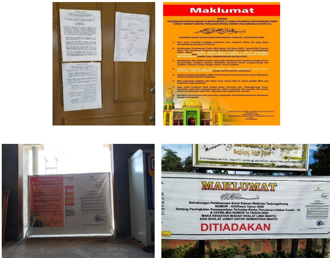
Gambar 5. Imbauan shalat di rumah