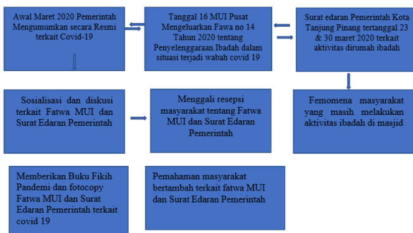
Gambar 3. Alur pelaksanaan pengabdian

Untuk selengkapny berikut adalah alur gambaran pelaksanaan pengabdian yang dilakukan: