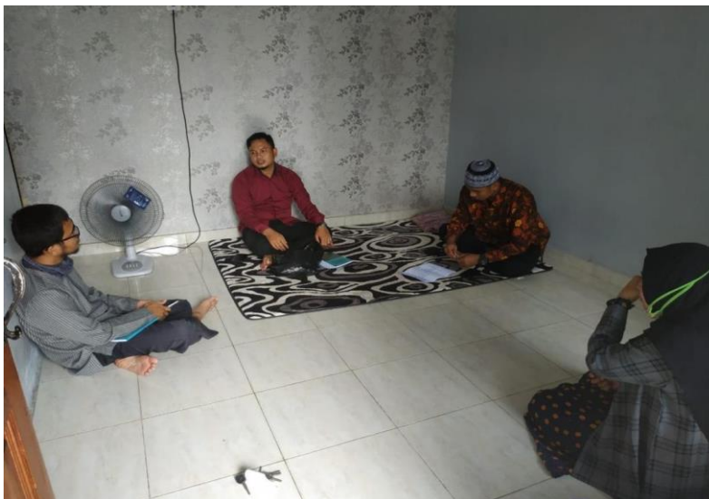
Gambar 2. Persiapan tim pengabdian

Setelah mendapatkan nama-nama serta lokasi yang dijadikan tempat pengabdian selanjutnya tim bergerak melakukan komunikasi dan konsolidasi dengan pengurus masjid melalui via whatsapp dan bertemu langsung menyampaikan perihal pengabdian ini. Seluruh pengurus yang diajak berkomunikasi menyambut baik perihal ini.