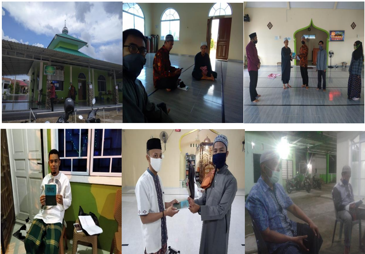
Gambar 4. Dokumentasi pengabdian masyarakat

Berikut adalah dokumentasi terkait pelaksanaan hal tersebut: