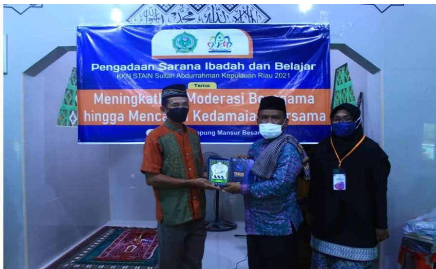
Gambar 5. Penyerahan Sarana Ibadah dari Perwakilan Donatur ke Guru TPQ Al-Qiraam.