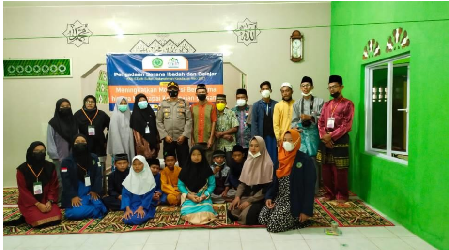
Gambar 3. Narasumber, Peserta Sosialisasi Moderasi Beragama, Peserta KKN Kelompok I