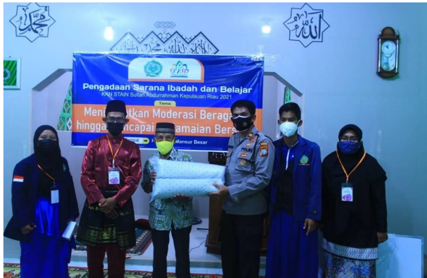
Gambar 4. Penyerahan Sarana Ibadah dan Alat Tulis dari Perwakilan Donatur ke Masyarakat