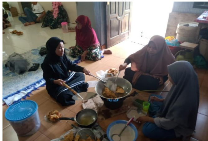
Gambar 3. Pengolahan Peyek Keping

Pelaksanaan pembuatan produk peyek keping dapat terlihat dari gambar berikut ini: