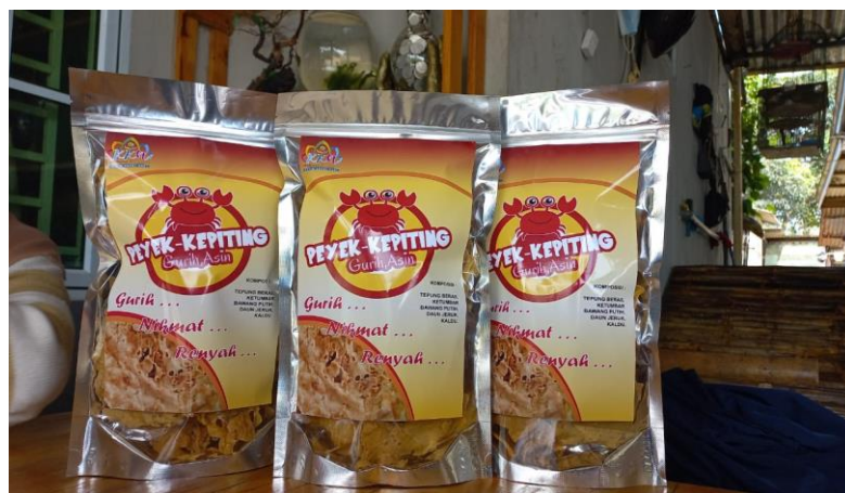
Gambar 7. Produk Peyek Kepiting

Secara umum, peserta berpendapat bahwa pelatihan yang diberikan memberi manfaat bagi mereka, lihat Gambar 6. dari 15 peserta yang mengikuti kegiatan 33,3% peserta yang merasa bermanfaat serta 60% menilai kegiatan ini sangat bermanfaat. Perihal manfaat apa saja yang diperoleh, ada yang menyatakan bahwa kegiatan ini memberi mereka pengetahuan dan juga pemahaman baik dari pengolahan, masalah packing serta rencana pemasaran.