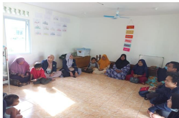
Gambar 2. Diskusi Dengan Ibu-Ibu Majelis Ta'lim

Tahap awal dari kegiatan pengolahan kepiting ialah melakukan diskusi dengan ibu-ibu Majelis Ta'lim Kampung Teluk Dalam. Hal ini bertujuan untuk mengetahui pengetahuan awal ibu-ibu Majelis Ta'lim serta harapan mereka. Kegiatan ini dilakukan dengan cara diskusi interaktif antara ibu-ibu Majelis Ta'lim dengan mahasiswa KKN kelompok 10 serta melemparkan pertanyaan-pertanyaan sederhana kepada ibu-ibu Majelis Ta'lim sebagai alat bantu untuk mengumpulkan data. Kegiatan ini dilakukan di ruang TPQ Masjid Darussalam Kampung Teluk Dalam. Selanjutnya dari kegiatan ini membahas perihal rencana yang akan dilakukan setelah mengetahui produk yang akan di buat yakni peyek kepiting.