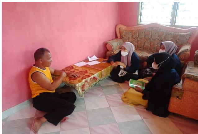
Gambar 1. Wawancara Dengan Nelayan Kepiting

gereja yakni Gereja St Petrus yang tentunya digunakan sebagai tempat ibadah. Masjid Darussalam Kampung Teluk Dalam selain digunakan sebagai tempat beribadah juga digunakan sebagai tempat sosial dan pendidikan. Disana terdapat TPQ yang santriwan/santriwatinya sebanyak 30 yang melakukan rutinitas belajar dari jam 1 siang sampai menjelang waktu shalat Ashar setiap hari Senin sampai Kamis. Dalam hal ini TPQ Darussalam merupakan suatu wadah untuk menunjang sektor pendidikan. Di kampung Teluk Dalam juga terdapat penyuluh agama yang kerap disapa pak dai yang bertugas sebagai tempat konsultasi dalam permasalahan agama serta melakukan bimbingan dan pengarahan kepada masyarakat akan ajaran agama dan mendorong untuk melaksanakannya (Kusnawan, 2011).