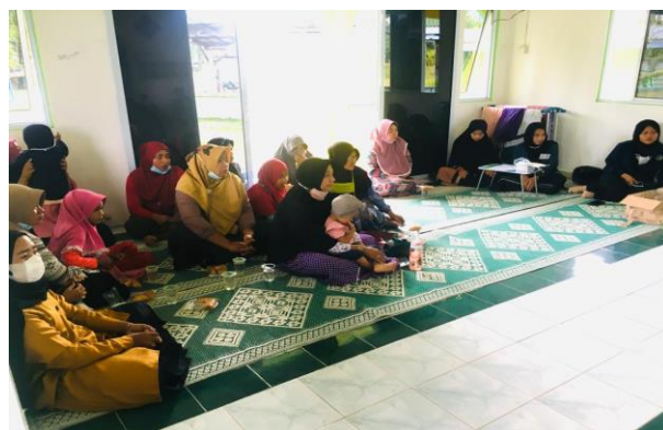
Gambar 4. Sharing Tentang Masalah Pemasaran

Dapat dilihat bahwasannya dari 1 kg kepiting di dapatkan 23 pcs peyek kepiting dengan berat 50 gram dengan harga jual per bungkus Rp14.000. untuk biaya produksi 1 kg peyek kepiting ialah Rp124.000 jika dihitung maka 1 bungkus peyek kepiting profit yang didapatkan ialah Rp8.700 dengan biaya produksi per bungkus sebsar Rp5.300. biaya produksi ini mencakup biaya operasional dan packaging .