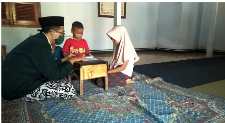
Gambar 2. Mengajar Membaca Al-Qur'an bagi Anak-Anak

Setelah kegiatan pengajaran Alqur'an bersama anak-anak dari Pos PAUD Bunga Nirwana, dapat membantu mereka semakin termotivasi dan semangat dalam belajar membaca Alqur'an. Terutama bagi anak-anak yang juga sedang belajar di Taman Pendidikan Alqur'an (TPQ). Kegiatan ini juga menambah intensitas bagi anak-anak untuk berinteraksi dengan Alqur'an. Sehingga diharapkan dengan semakin seringnya anak-anak berinteraksi dengan pembelajaran Alqur'an, anak-anak akan semakin dini mahir membaca Alqur'an.