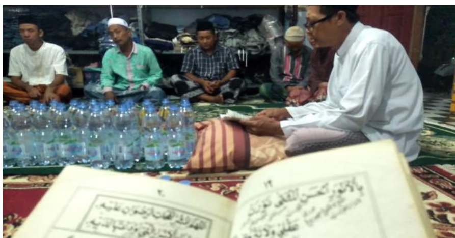
Gambar 1. Kegiatan Pembacaan Manaqib Syaikh Abdul Qadir Al-Jaelani

Kemudian tradisi keagamaan yang lainnya yang tetap di pertahankan oleh warga desa Rowokembu adalah kegiatan Manaqiban dan Marhabanan . Kegiatan Manaqiban biasanya dilaksanakan di masing-masing rumah warga tergantung pada tuan rumah kapan kegiatan ini akan dilaksanakan. Ketika penulis mengikuti kegiatan tersebut pada tanggal 2 Juni 2021 kegiatan Manaqiban dilangsungkan di kediaman bapak Salafuddin, dan esoknya tanggal 3 Juni 2021 di kediaman bapak Mahmudi. Sedangkan kegiatan Marhaban dilaksanakan di rumah penulis sendiri pada tanggal 27 Mei 2021, bertepatan dengan pembukaan rutinan tersebut pada malam jumat. Berbeda dengan kegiatan Manaqiban yang biasanya hanya di ikuti keluarga dekat, jika kegiatan Marhabanan ini lebih di tekankan kepada remaja dan anak-anak. Cara yang paling digandrungi saat ini dalam melestarikan tradisi marhabanan ini adalah dengan meramaikannya melalui seni shalawat hadrah . Munculnya berbagai grup hadrah menambah semangat generasi muda untuk ikut hadir dan meramaikan acara-acara marhabanan atau Maulid Nabi yang diadakan. Ada beberapa grup hadrah yang saat ini sedang banyak digandrungi. Sebut saja ada Ahbabul Musthofa dari Solo, Az-Zahir dari Pekalongan, dan Syubbanul Muslimin dari Probolinggo (Amaliah, 2021). Dengan ikut sertanya masyarakat secara sadar dalam berbagai kegiatan religi ini, maka menunjukkan bahwa masyarakat secara sadar terlibat dalam upaya pemberdayaan berbasis partisipasi sosial (Handayani, 2006).