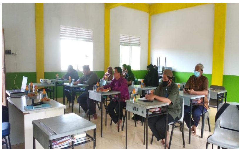
Gambar 3. Proses dilakukan PreTest literasi produk dan jasa Koperasi syariah

Berdasarkan hasil pretest yang dilakukan diketahui bahwa hanya sekitar 10 – 12 % yang memberikan jawaban sangat setuju terhadap penerapan system koperasi berbasis syariah dan 80 % setuju dari 20 pertanyaan yang diberikan melalui google form tersebut. Setelah dilakukan penyuluhan melalui seminar dan selanjutnya dilakukan posttest tentang akad-akad koperasi berbasis syariah melalui google form kembali. Hasilnya terjadi peningkatan terhadap pilihan sangat setuju sekitar 70 % dari 16 pertanyaan yang diberikan melalui google form tersebut