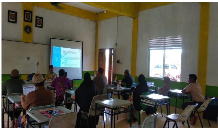
Gambar 4. Proses dilakukan Post Test literasi produk dan jasa Koperasi Syariah