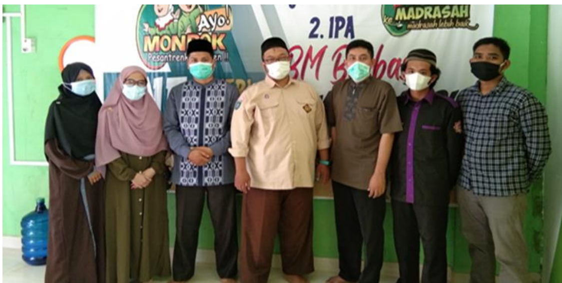
Gambar 1. Pelaksanaan survey lokasi pengabdian kepada masyarakat di Koperasi Idris Berkah Sejahtera Bersama, 26 Juli 2021

Tim Pengabdian Prodi Hukum Ekonomi Syaria'ah (HESY) Tahun 2021 yang terdiri dari 4 orang dosen dan 1 mahasiswa STAIN Sultan Abdurrahman Kepulauan Riau yang berjudul Peningkatan Literasi Koperasi Sebagai Layanan Penghimpun dan Pemberi Modal Berbasis Syaria'ah Kepada Masyarakat pada Kondisi Covid-19 mendatangi Lembaga Koperasi syariah yang sudah ditetapkan. Selanjutnya tim pelaksanaan menentukan sasaran pengabdian ini adalah pengurus koperasi yang terdiri dari ketua, sekretaris, bendahara dan pengawas.