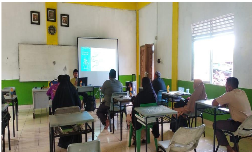
Gambar 2. Penyampaian seminar kepada peserta seminar dari anggota dan pengurus Koperasi

Pengabdian ini dilakukan dengan mengawali penyuluhan untuk menyampaikan kepada anggota koperasi bahwa pentingnya sistem koperasi syariah diterapkan dalam menghimpun dan menyalurkan dana, terlebih lagi dana anggota koperasi. Sasaran kegiatan pengabdian ini adalah koperasi syariah yang ada di Kabupaten Bintan khususnya koperasi Idris Berkah Sejahtera Bersama yang sudah mengarah kepada koperasi syariah.