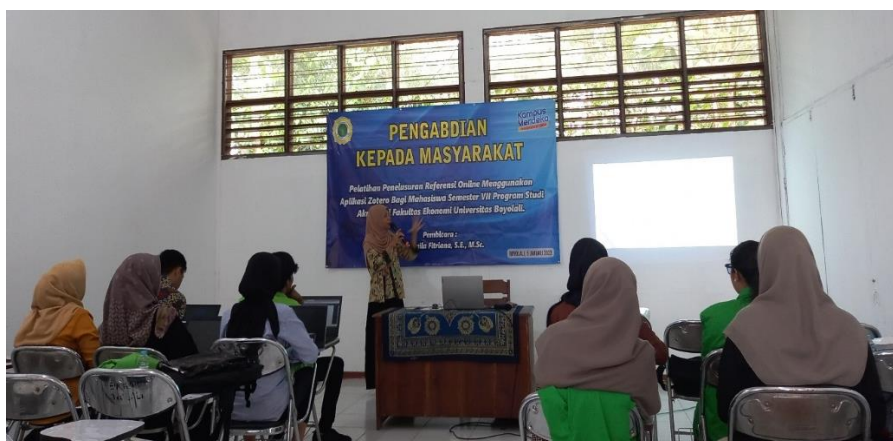
Gambar 3. Sesi Pemaparan Materi

Hasil dari penyampaian materi (sesi I) adalah mahasiswa lebih memahami jenis-jenis penelitian dalam artikel ilmiah, menghindarkan plagiarisme dengan mencantumkan sitasi untuk meningkatkan kesadaran tidak membudayakan copy paste , mengetahui perbedaan gaya penulisan bibliografi, serta bagaimana cara mencari jurnal internasional maupun nasional yang terindeks guna meningkatkan kredibilitas sumber penelitian. Berikut ini adalah gambar 3 yang menampilkan saat para peserta pelatihan menyimak materi yang disampaikan oleh dosen pengabdian dengan baik.