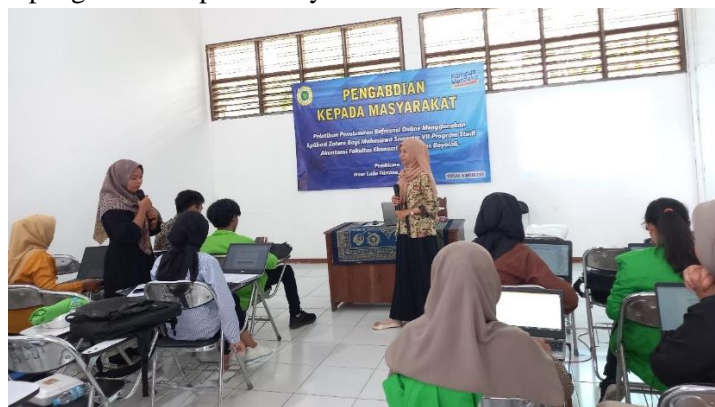
Gambar 5. Diskusi Interaksi dengan Peserta Pelatihan

Bila dilihat dari hasil rata-rata persentase jawaban responden menunjukkan bahwa tingkat keberhasilan dari kegiatan pengabdian melebihi dari indikator yang telah ditentukan sebelumnya yakni 80%, sehingga dapat dikatakan jika kegiatan pengabdian kepada masyarakat berjalan dengan baik. Hasil ini diperkuat saat sesi diskusi tanya jawab, sebagian besar tanggapan dan umpan balik dari peserta mengungkapkan bahwa kegiatan pelatihan ini sangat bermanfaat dan membantu dalam menyusun penulisan artikel penelitian. Khususnya, peserta yang selama ini menyusun bibliografi masih secara manual dengan format yang tidak konsisten. Berikut ini adalah gambaran sesi diskusi dan foto bersama para peserta pelatihan sebagai penanda kegiatan pengabdian kepada masyarakat telah selesai dilaksanakan.