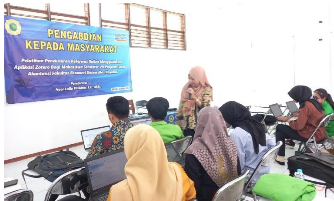
Gambar 4. Sesi Praktik Pelatihan Zotero