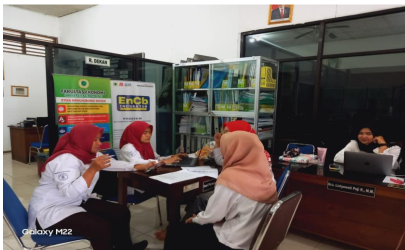
Gambar 1. Persiapan dan Koordinasi

sebagai media komunikasi online apabila terdapat peserta yang mengalami kendala dan membutuhkan bimbingan lebih lanjut selama program pelatihan. Selanjutnya, penentuan waktu pelaksanaan kegiatan dirumuskan bersama partisipan untuk mengatur kesesuaian waktu antara peserta pelatihan dan pelaksana.