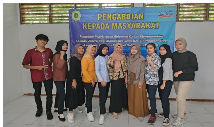
Gambar 6. Foto Bersama Peserta Pelatihan