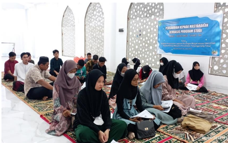
Gambar 3. Peserta Sosialisasi