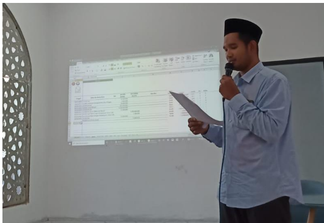
Gambar 6. Evaluasi oleh Narasumber