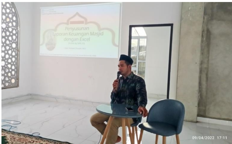
Gambar 4. Narasumber Memberikan Pelatihan

diberikan guna untuk mempermudah pemahaman dan juga sebagai bahan referensi dalam melakukan penyusunan laporan keuangan.