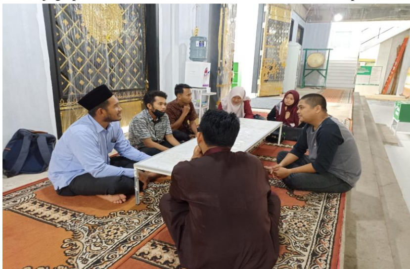
Gambar 1. Diskusi bersama ketua Remaja Masjid Al-Uswah

Persiapan dilakukan oleh Tim Pengabdian guna untuk mendapatkan informasi dalam rangka pengumpulan data terkait lokasi pengabdian dan rencana kegiatan. Pada tahap ini tim pengabdian melakukan koordinasi kepada manajemen masjid melalui Dewan Kemakmuran Masjid (DKM) Masjid Al-Uswah terkait izin penggunaan fasilitas dan pelaksanaan kegiatan pengabdian di Masjid Al-Uswah Kota Tanjungpinang. Dalam tahapan ini juga tim membahas bersama anggota DKM Masjid terkait pelaksanaan kegiatan pengabdian dalam bentuk pelatihan penyusunan laporan keuangan masjid yang akan dilaksanakan dan juga pelaksanaan safari Ramadhan sebelum berbuka puasa.