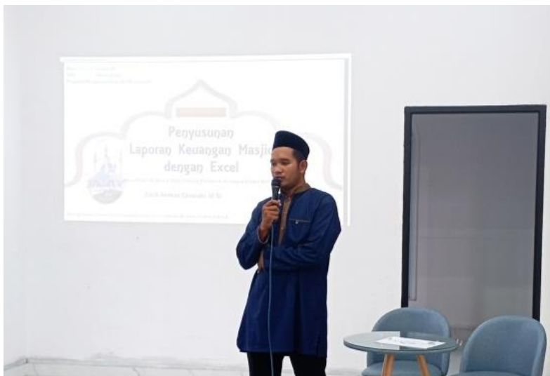
Gambar 2. Proses Sosialisasi

sosialisasi, pelatihan dan evaluasi penyusunan laporan keuangan masjid. Kegiatan ini juga ditujukan kepada anggota DKM Masjid Al-Uswah guna untuk menjalin kerjasama dalam pelaksanaan pelatihan nantinya.