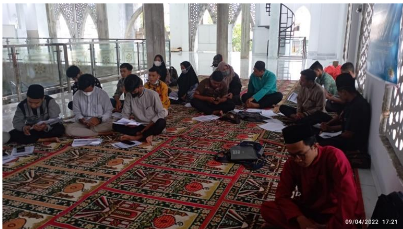
Gambar 5. Peserta Pelatihan