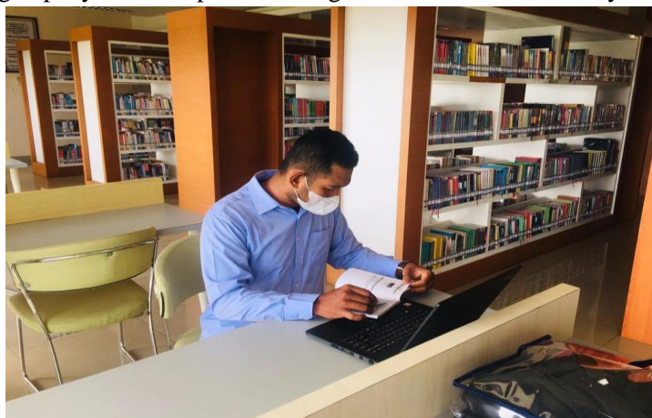
Gambar 7. Studi Pustaka oleh Pengabdian

Pengumpulan referensi perpustakaan dilakukan pada Perpustakaan dan Arsip Daerah Provinsi Kepulauan Riau. Tujuan pengumpulan referensi perpustakaan untuk mendukung hasil dari pengabdian yang menjadi sebuah penelitian berbentuk laporan akhir pengabdian, dummy book dan jurnal pengabdian. Jurnal pengabdian nantinya dapat dijadikan sebagai salah satu referensi untuk melakukan pengabdian ataupun penelitian terkait dengan penyusunan laporan keuangan entitas nirlaba khususnya masjid.