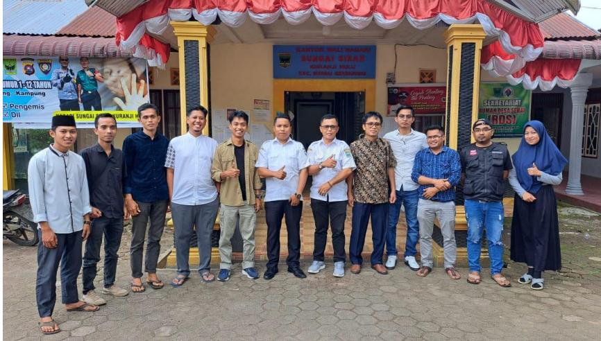
Gambar 1. Foto Bersama Tahapan Pemetaan Kebutuhan di Depan Kantor Nagari Sungai Sirah Kuranji Hulu

Sirah Kuranji Hulu terkait dengan alat dan bahan yang harus dipersiapkan dan jadwal kesiapan peserta. Selanjutnya melakukan kesepakatan waktu pelaksanaan pemetaan kebutuhan, pelatihan dan evaluasi dari hasil pelatihan. Setelah informasi dan waktu pelaksanaan didapatkan, tim pelaksana Pengabdian Kepada Masyarakat (PKM) dari Fakultas Sains dan Teknologi Universitas Islam Negeri (UIN) Imam Bonjol Padang melakukan persiapan bahan dan materi untuk pelaksanaan pelatihan. Dokumentasi kegiatan pemetaan dapat dilihat pada Gambar 1 berikut: