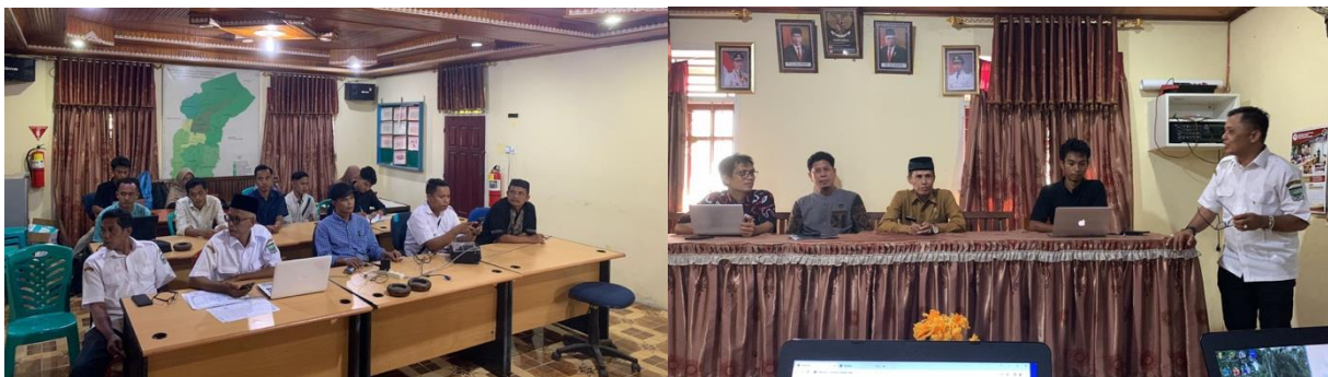
Gambar 11. FGD Persiapan Pembuatan Website Nagari