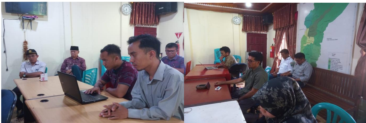
Gambar 10. Pelatihan Pembuatan Konten Publikasi Yang Menarik