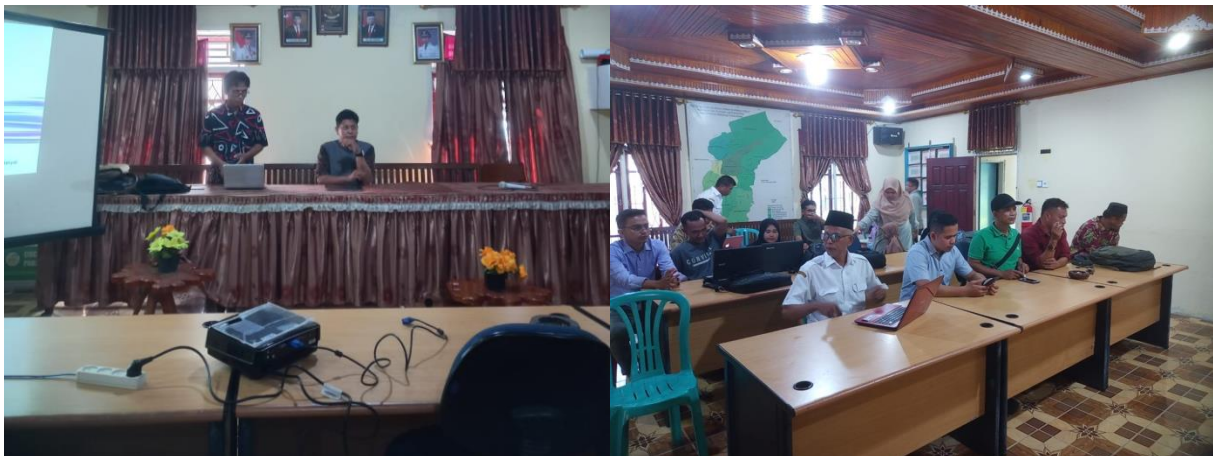
Gambar 5. Diskusi Dengan Perangkat Nagari Terkait Media Informasi Desa