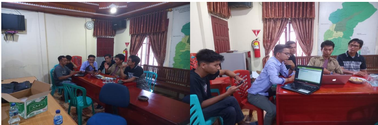
Gambar 12. Pelatihan Pembuatan Website Nagari

Adapun tahap terakhir adalah evaluasi yang dilaksanakan pada tanggal 5-6 Juni 2023. Kegiatan ini dilakukan guna untuk mengukur ketercapaian tujuan dari kegiatan Pengabdian Kepada Masyarakat (PKM) yang telah dilakukan. Evaluasi dilakukan dengan cara survey menggunakan google form. Survey dilakukan dengan membagikan kuesioner kepada seluruh peserta yang mengikuti kegiatan pelatihan, hasil survey dapat dilihat pada Tabel 2 berikut: