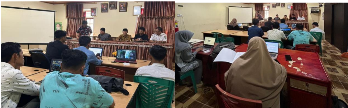
Gambar 4. Pemaparan Materi Tentang Literasi Digital Dalam Pengelolaan Media Informasi Desa

Pada tahapan pelaksanaan ini, peserta kegiatan yang sebelumnya tidak memiliki latar belakang dalam pengembangan website diajarkan dalam mendaftarkan nama domain dan memilih penyedia layanan hosting, menginstall wordpress, kemudian melakukan instalasi wordpress pada hosting dan memasang tema yang telah di pilih. Pengaturan menu pada tema dilakukan untuk merealisasikan daftar menu yang telah disepakati pada saat FGD. Proses selanjutnya dengan melakukan pengembangan konten website dan melakukan posting informasi ke dalam website . Pelaksanaan pelatihan pada hari keempat dilakukan dengan peluncuran website yang diikuti oleh seluruh perangkat Nagari. Dokumentasi kegiatan pada tahapan kegiatan ketiga sebagai berikut: