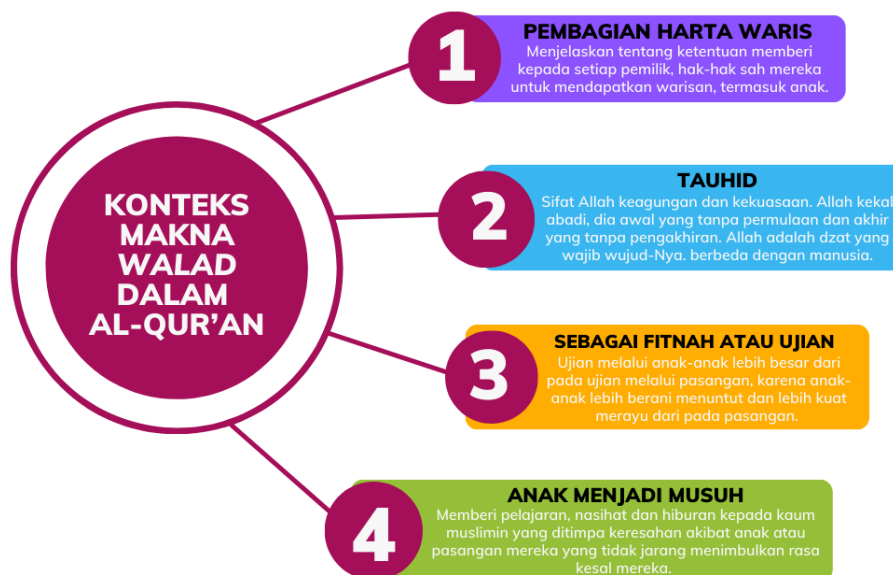
Gambar 1. Konteks Makna Walad dalam Al-Qur'an Perspektif Tafsir Al-Misbah

Konteks makna walad sebagai musuh dalam Tafsir Al-Misbah yakni memberi pelajaran, nasihat dan hiburan kepada kaum muslimin yang ditimpa keresahan akibat anak atau pasangan mereka yang tidak jarang menimbulkan rasa kesal mereka. Ayat tersebut bagaikan menyatakan “ hai orang-orang yang beriman, sesungguhnya sebagian pasangan-pasangan kamu yakni istri atau suami kamu walau mereka menampakkan kecintaan yang luar biasa dan juga sebagian dari anak-anak kamu, kendati mereka menunjukkan kasih sayang dan kebutuhan kepada kamu —sebagian dari mereka itu —adalah musuh bagi kamu atau bagaikan musuh. Ini karena mereka dapat memalingkan kamu dari tuntunan agama, atau menuntut sesuatu yang berada di luar kemampuan kamu sehingga akhirnya kamu melakukan pelanggaran, maka berhati-hatilah terhadap mereka jangan sampai mereka menjerumuskan kamu dalam bencana; dan jika kamu memaafkan kesalahan mereka yang dapat ditoleransi dan berpaling tidak mengecam atau marah atas kesalahan mereka serta mengampuni kesalahan mereka dengan tidak menyampaikan kepada pihak lain, maka Allah akan menutupi juga aib dan kesalahan kamu karena sesungguhnya Allah Maha Pengampun lagi Maha Penyayang. ” Beberapa pasangan dan anak-anak bersikap demikian. Meskipun tidak semuanya, ketahuilah bahwa semua harta dan anak-anak kamu adalah ujian bagi dirimu: dari mana kamu memperoleh harta itu, bagaimana kamu membelanjakannya, serta bagaimana kamu memperlakukan dan mendidik istri serta anak-anakmu. 30