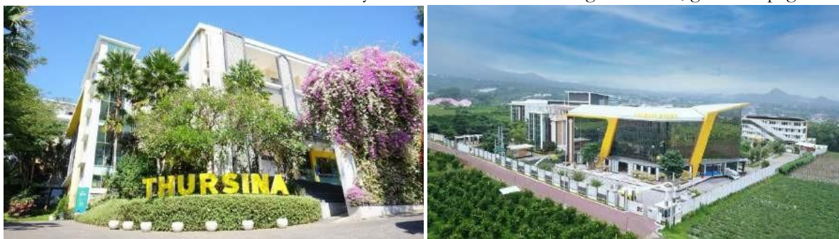
Tanjak: Journal of Education and Teaching, Vol. 4, No. 1, 2023

Saat ini ada dua kampus utama yang dimiliki oleh Thursina IIBS Malang. Kampus satu disiapkan untuk Siswa putri dan kampus dua disiapkan untuk Siswa putra. Kampus yang ada dilengkapi dengan fasilitas yang baru yang modern dengan desain khusus yang dapat memberikan pengalaman belajar yang lebih maksimal dan. Untuk kampus putri, fasilitas ruang kelas, perpustakaan dan perkantoran terletak dalam satu Andalusia sedangkan untuk kampus putra terpusat di gedung Al-Azhar. Dua gedung ini di desain secara khusus untuk memberikan kenyamanan dan keefektifan kegiatan siswa, guru dan pegawai.