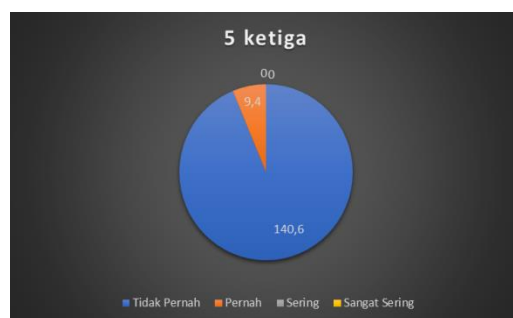
Gambar 3. Perilaku using others'names throught social network

Indikator yang keempat, yaitu menyebarkan rahasia orang lain di media sosial, dari 150 orang siswa, sebanyak 0,4% sering melakukannya, 8,4% siswa pernah melakukannya dan, 141% tidak pernah melakukannya. Indikator menyebarkan rahasia orang lain dilakukan untuk mendapatkan gambaran berupa seberapa sering siswa SMA N 1 Kepenuhan menyebarkan rahasia pribadi yang memalukan dan sensitif dari seseorang ke media sosial tanpa izin. Gambar 4 menunjukkan persentase penyebaran rahasia orang lain.