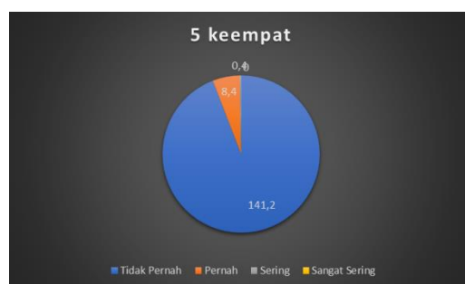
Gambar 4. Perilaku menyebarkan rahasia orang lain

Indikator yang keempat, yaitu menyebarkan rahasia orang lain di media sosial, dari 150 orang siswa, sebanyak 0,4% sering melakukannya, 8,4% siswa pernah melakukannya dan, 141% tidak pernah melakukannya. Indikator menyebarkan rahasia orang lain dilakukan untuk mendapatkan gambaran berupa seberapa sering siswa SMA N 1 Kepenuhan menyebarkan rahasia pribadi yang memalukan dan sensitif dari seseorang ke media sosial tanpa izin. Gambar 4 menunjukkan persentase penyebaran rahasia orang lain.