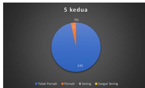
Gambar 2. Perilaku Slendering

Selanjutnya pada indikator kedua, yaitu slandering, dari 150 orang siswa yang mengisi questioner sebanyak 5% pernah melakukan tindakan slandering, kemudian 145 % menyatakan tidak pernah melakukan tindakan tersebut di sosial media. Tindakan slandering yang ditanyakan berupa memfitnah orang di media sosial dan atau membagikan foto memalukan orang lain dengan tujuan untuk mempermalukan seseorang, merusak reputasi seseorang, atau membuat orang lain membenci seseorang. Data mengenai tindakan slandering disajikan pada gambar 2.