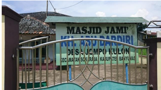
Gambar 6. Masjid Jami' K. H. Abu Dardiri

Dari beberapa sumber yang diperoleh kita mengetahui bahwasanya K.H. Abu Dardiri telah memberikan kiprahnya kepada Persyarikatan Muhammadiyah di Kabupaten Purbalingga dengan beberapa peninggalan beliau yang dapat kita saksikan hingga kini. Terkhusus dalam bentuk bangunan seperti gedung Pendopo K.H. Ahmad Dahlan yang dimana berkat jasanya gedung tersebut hingga kini masih digunakan sebagai kantor Pimpinan Daerah Muhammadiyah (PDM) Kabupaten Purbalingga. K.H. Abu Dardiri sebagai tokoh yang berkiprah pada awal pendirian Muhammadiyah di Kabupaten Purbalingga hingga saat ini Persyarikatan Muhammadiyah di Kabupaten Purbalingga masih tetap eksis.