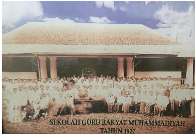
Gambar 1. Sekolah Guru Rakyat Muhammadiyah

Muhammadiyah cabang Purbalingga pada awalnya berpusat di kompleks Masjid At-Taqwa, Kelurahan Purbalingga Wetan (depan Kantor Kejaksaan Negeri) selanjutnya berpindah ke Pendopo K.H Ahmad Dahlan (Sekarang kompleks SMA Muhammadiyah 1 Purbalingga). Dengan adanya kantor pusat yang baru menjadi ghirah baru para kader Muhammadiyah untuk mengembangkan syiar Islam di Purbalingga. Hal ini nampak pada foto yang terdokumentasikan dengan tahun tertera 1927, dimana foto tersebut menggambarkan kelulusan para calon guru yang menimba ilmu di Sekolah Guru Rakyat Muhammadiyah di depan gedung pendopo K.H. Ahmad Dahlan. 16