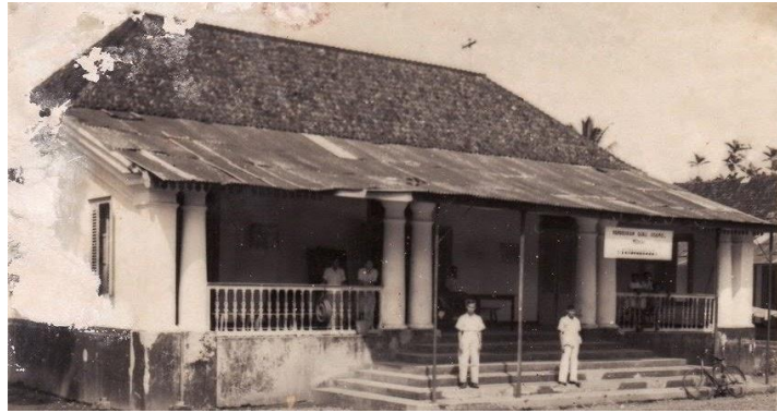
Gambar 4. Pendopo K.H. Ahmad Dahlan